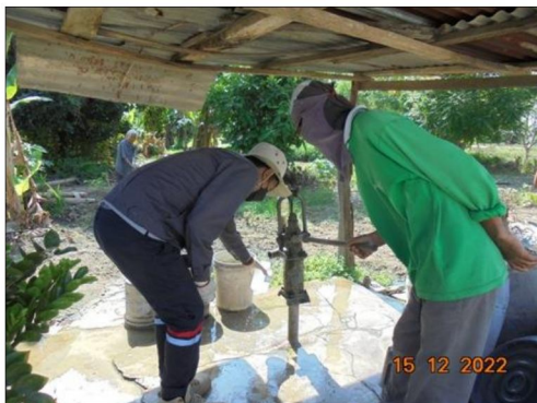
บริเวณบ้านมะเกลือ