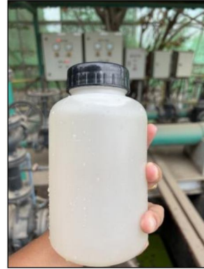
บ่อตรวจสอบคุณภาพน้ำทิ้ง