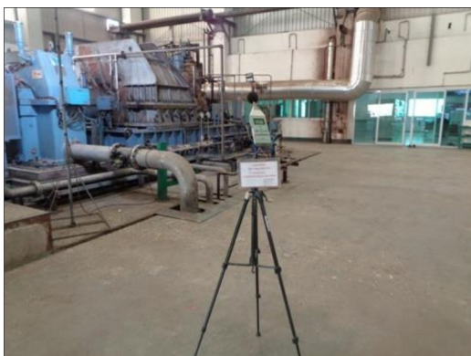
บริเวณอาคารเครื่องกำเนิดไฟฟ้ากังหันไอน้ำ