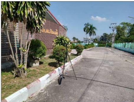
โรงพยาบาลส่งเสริมสุขภาพตำบลบ้านมะเกลือ