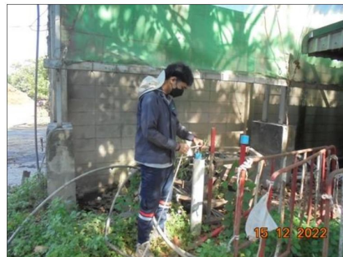
บ่อ Monitoring Well บริเวณลานกองขานอ้อย