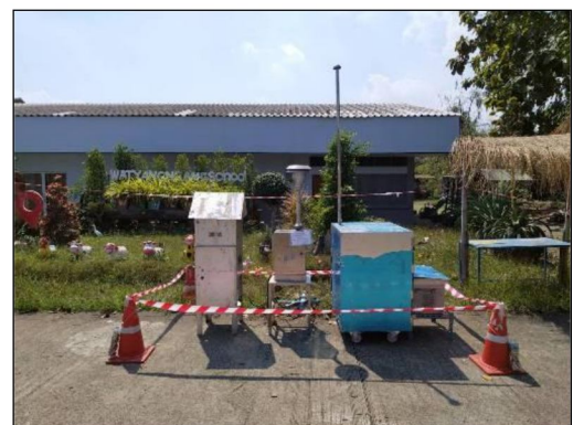
โรงเรียนวัดยางงาม