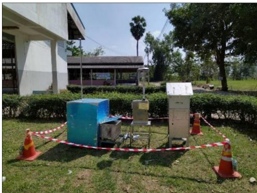
โรงเรียนบ้านแก่งขี้ขวดวิทยาคม