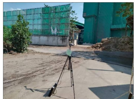
ริมรั้วโรงงานด้านทิศเหนือของโรงไฟฟ้า