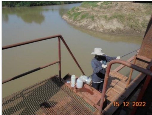
แม่น้ำปิงบริเวณโรงไฟฟ้า