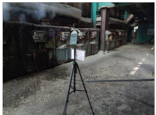
บริเวณหม้อไอน้ำ