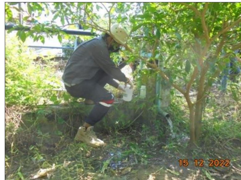
บริเวณบ้านวังยาง