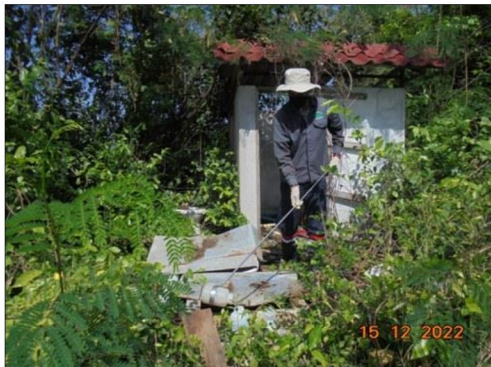
บริเวณโรงเรียนบ้านแก่งซังลิตวิทยา