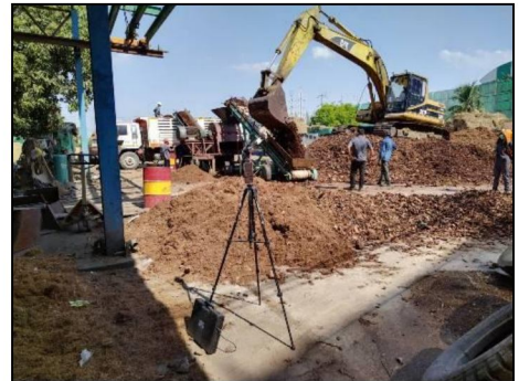
บ้านที่ติดโรงงานมากที่สุดทางทิศเหนือของโรงไฟฟ้า