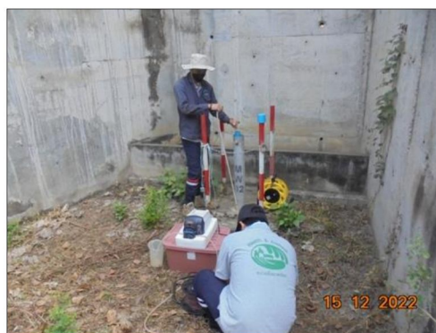
บ่อ Monitoring Well บริเวณระบบบำบัดน้ำเสีย